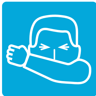
Che lại khi ho