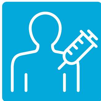
Trích ngừa cúm