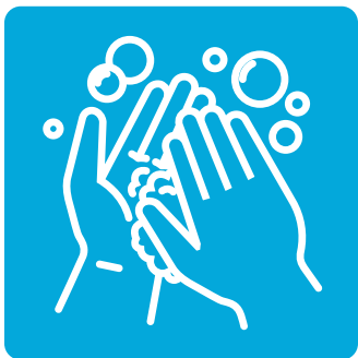
Rửa tay của bạn